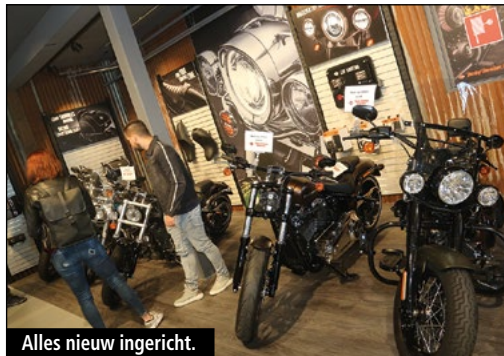
Alles nieuw ingericht.