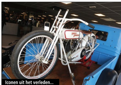
Iconen uit het verleden...

Vele honderden bezoekers genoten bij een stralend voorjaarszonnetje van een unieke Harley-sfeer en de straten rondom het totaal vernieuwde dealership aan de Jarmuiden stonden stampvol motoren.