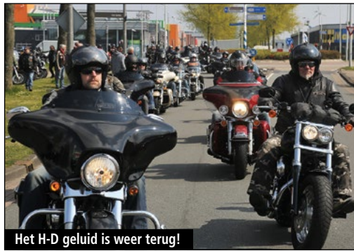
Het H-D geluid is weer terug!

Op zaterdag 13 april beleefde het nieuwe Harley-Davidson Amsterdam haar officiële, grootse opening. Een mooi feest bij de zeer welkome terugkeer van Harley-Davidson in de hoofdstad!